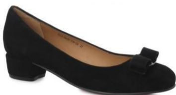
Туфли классические, возможен устойчивый каблук 3 сантиметра, цвет черный

МБОУ Г. КЕРЧИ РК ШКОЛА № 23 ИМ. ГЕРОЯ СОВЕТСКОГО СОЮЗА С.Д. ПОШИВАЛЬНИКОВА