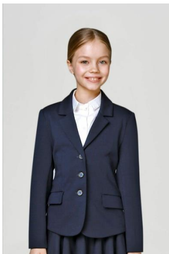
Жилет, кардиган синий